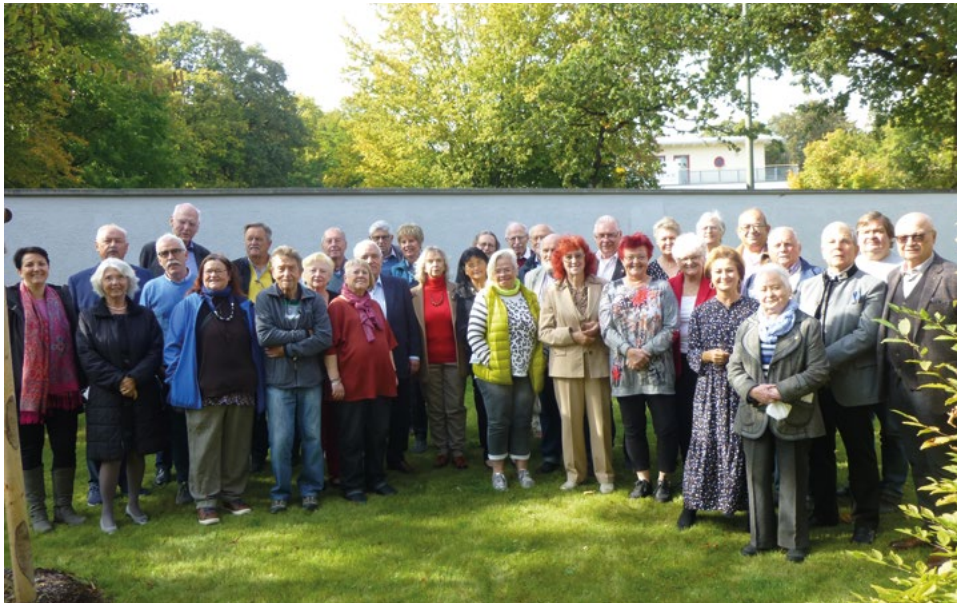
Die Mitglieder des Seniorenbeirates.

Bitte beachten Sie auch die aktuellen Bekanntmachungen und Veranstaltungshinweise des Seniorenbeirats auf der Internetseite der Stadt Augsburg unter augsburg.de/seniorenbeirat